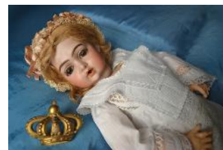
Tra i giocattoli esposti: il Meccano, lo chalet di Biancaneve, la miniatura di un negozio di fiori e la bambola "Elena"

Inoltre un cavallino di legno, una macchinina a pedali e un'esposizione di giochi basati sulla destrezza, sull'agilità, sulla velocità e sulla coordinazione, che contribuivano a sviluppare abilità che si sarebbero rivelate utili quando il bambino fosse diventato grande: cerchi, trampoli e tricicli, bocce e croquet, racchette da volano, trottole e l'ingegnoso "perfect tennis trainer" di manifattura inglese con la scatola che riporta la frase "utilizzato dal Principe di Galles".