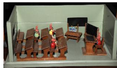
Altri giocattoli: un antico cavallino di legno, un cerchio, giochi di società e una scuola in miniatura