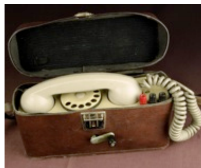
Tra gli oggetti in vendita abiti settecenteschi, scarpette da tango, manifesti pubblicitari, vecchi esemplari di telefoni...