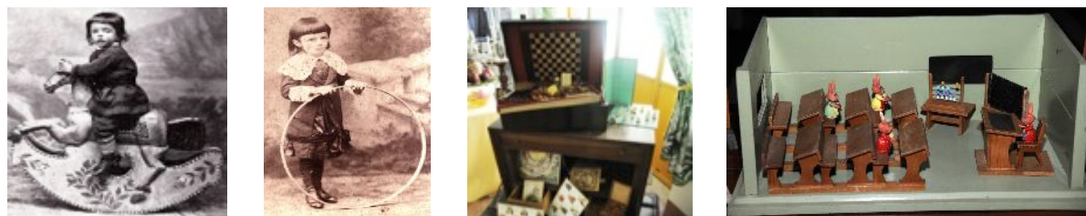
Altri giocattoli: un antico cavallino di legno, un cerchio, giochi di società e una scuola in miniatura

Inoltre un cavallino di legno, una macchinina a pedali e un'esposizione di giochi basati sulla destrezza, sull'agilità, sulla velocità e sulla coordinazione, che contribuivano a sviluppare abilità che si sarebbero rivelate utili quando il bambino fosse diventato grande: cerchi, trampoli e tricicli, bocce e croquet, racchette da volano, trottole e l'ingegnoso "perfect tennis trainer" di manifattura inglese con la scatola che riporta la frase "utilizzato dal Principe di Galles".