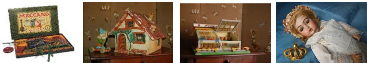
Tra i giocattoli esposti: il Meccano, lo chalet di Biancaneve, la miniatura di un negozio di fiori e la bambola "Elena"

Fra i giocattoli esposti anche bambole : la bambola "Elena", così chiamata in onore di colei che la donò alla madre dell'attuale proprietario: la Regina Elena infatti regalò nel 1911 questa bambola di porcellana, con un corredo degno di una principessa. Accanto alla culla di Elena, ecco apparire altre bambole, sicuramente altrettanto amate dalle loro proprietarie, e una casa di bambole.