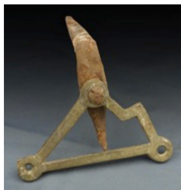
Alcuni oggetti misteriosi provenienti dai cassetti e dagli armadi del Castello di Pralormo

Anche in questa occasione il Castello ospita, tra i partecipanti, due associazioni benefiche torinesi.