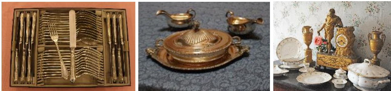
Importanti servizi da tavola, cristalli, argenterie e porcellane

Tavole con ceramiche di Mondovì, di Gien, di Bassano, cristalli e argenterie rievocano l'atmosfera familiare delle antiche case aristocratiche, dove “la convivialità è il fascino senza tempo di oggetti creati per il piacere di stare insieme...”