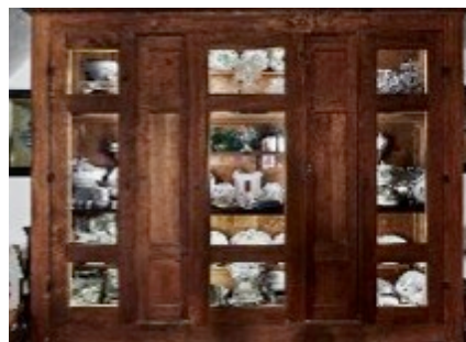
Oggetti provenienti da soffitte, solai e cantine di antiche dimore