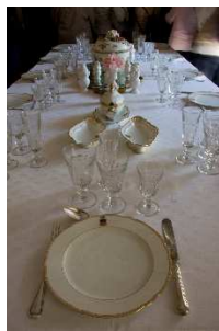
2 – La tavola dell'Ambasciatore