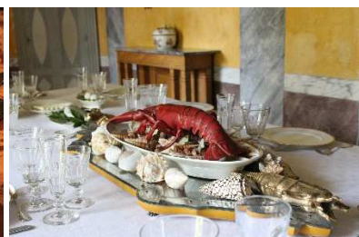
19 – La tavola dedicata ai pescatori con centrotavola di conchiglie