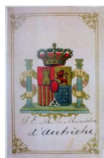
10 – Menu per un pranzo internazionale