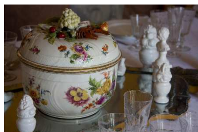
12 – Servizio di Meissen, zuppiera

Ma i veri protagonisti delle tavole sono i piatti, che tematizzano ogni tavola e che testimoniano anche l’internazionalità delle famiglie aristocratiche: servizi di Meissen dalla Germania, Gien e Limoges dalla Francia, Wedgwood dall’Inghilterra, porcellane di Vienna dall’Austria, ma anche pregiate porcellane e lacche provenienti dall’ Oriente che venivano portate dai piemontesi produttori di seta di ritorno dai viaggi che svolgevano alla ricerca dei semi-bachi da seta.