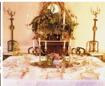
4 – Tavola allestita con il servizio “Le roselline” di Ginori