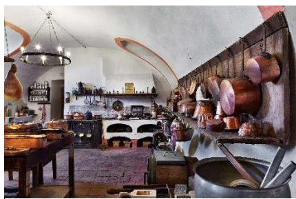
6 – Le grandi cucine del Castello