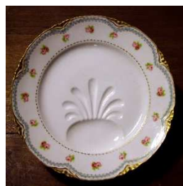
16 – Piatto da asparagi del servizio “Le roselline” di Ginori

ceramiche francesi decorate da strofe romantiche sulle rose . La famiglia è da sempre particolarmente appassionata di cioccolata , sono infatti esposte delle tazze dorate “miroir” che riflettono i decori del piattino sottostante, e si racconta del diario conservato nell’archivio del Castello di Filippo Domenico Beraudo di Pralormo che, inviato nel 1730 in Sardegna dal Duca Vittorio Amedeo II, confida il rammarico per la mancanza della “cioccolata”, cibo allora sconosciuto in Sardegna, ed esprime il desiderio di farla arrivare dal Piemonte. Il “ caffè dei cavalieri ”; la tavola dedicata agli amici pescatori con porcellane con pesci tutti diversi e un centrotavola di conchiglie; il “ té alla russa ” con Samovar e porcellane decorate da uova stile Fabergé, che ricordano la Principessa Leonilla Bariatinski , trisnonna degli attuali proprietari e famosa bellezza europea rinomata per i propri ricevimenti nel Palazzo di San Pietroburgo.