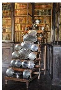
21 – Servizio di argenteria

Anche l’utilizzo delle posate è ben illustrato, quasi ogni cibo aveva la posata dedicata, come ogni salsa aveva la propria salsiera... ecco quindi salsiere, saliere e oliere, insieme a tutto ciò che faceva e fa parte dell’allestimento di tavola, una vera arte raffinata.