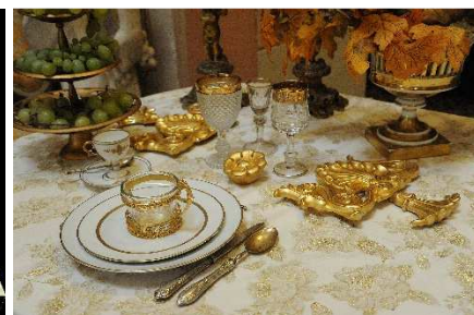
23 – Servizio di argenteria “vermeille” per la tavola delle “nozze d’oro”