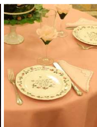
17 – “La tavola della poesia”