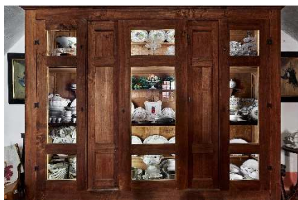
5 – L’armadio delle porcellane del Castello

Nel percorso di visita viene raccontato ciò che accadeva dal XVIII al XX secolo, non solo nei saloni ma anche nelle stanze delle porcellane , dove gli armadi custodiscono ancora oggi argenteria e servizi di piatti, bicchieri e posate, e nelle grandiose cucine , con un’importante dotazione di lucidissime pentole di rame per ogni tipo di cottura, alcune ghiacciaie, attrezzature per sorbetti e gelati, e l’angolo del pasticciare, con tanti strumenti curiosi e precursori di quelli utilizzati dagli chef di oggi... Tutto questo a volte era portato in dote dalle spose e poi tramandato di generazione in generazione.