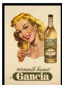
25 – Manifesto Gancia – Vermouth bianco, 1954

I pezzi esposti sono una selezione proveniente da una collezione di famiglia, ricca raccolta torinese nata dall'interesse per la grafica di Elvio Soleri (1944-2015) attraverso quarant'anni di appassionate ricerche: manifesti pubblicitari, cartoncini, locandine, scatole in latta, dépliant turistici, cartoline illustrate, bozzetti originali, figurini di moda, stampe non pubblicitarie, riviste d'epoca, oggetti pubblicitari, tabelle in latta, trofei e statuette a soggetto sportivo.