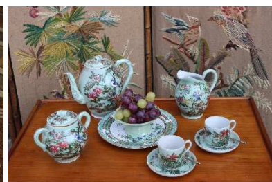
15 – Dall’Oriente: porcellane cinesi

Per citare solo alcuni degli allestimenti: la tavola con un servizio di Ginori ; la tavola con un servizio di Gien ; la tavola con porcellane di Vienna in onore dell’ Ambasciatore Carlo Beraudo di Pralormo , per dieci anni Ambasciatore a Vienna diventato amico del Principe di Metternich, che percorreva in carrozza il percorso da Vienna a Torino documentato dalle sue mappe e dagli oggetti che utilizzava nelle soste di viaggio, come curiosi bicchieri e porcellane. La Contessa Matilde , amante delle rose (che si possono ammirare ancora oggi nel giardino), è rappresentata nella tavola “della poesia” , con