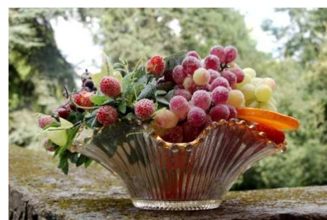
11 – Una ricetta del Castello: “L’uva brinata”

Spesso i destini delle nazioni si sono decisi e si decidono ancora oggi a tavola... proprio questo conferma l’importanza che si dava sia all’allestimento della tavola che alla scelta delle portate, che sovente erano elencate sul menu con nomi che ricordavano la provenienza degli ospiti più importanti.