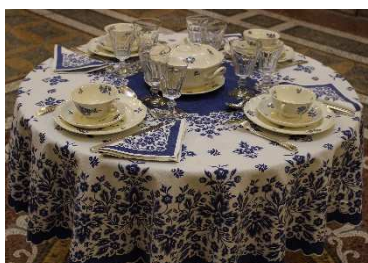
14 – Servizio di Wedgwood