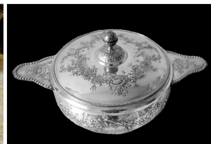
24 – Curiosa legumiera in argento con decori sul tema del giardino

Ai bambini erano dedicate posate d’argento particolari e piatti scaldapappe inusuali... e che meraviglia i servizietti di porcellana anche per le bambole! A proposito di bambole... oltre a quelle di porcellana bisquit arrivate da Parigi nel XIX secolo, con corredi di anche 30 vestitini, altre bambole del XX secolo rappresentano il prezioso personale che accudiva il Castello e i bambini, come la bambinaia, la cameriera, la cuoca, il giardiniere... una vera chicca!