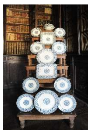
13 – Servizio di Gien