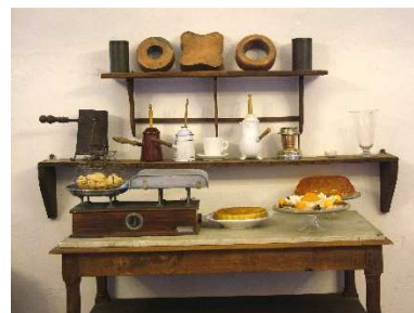
7 – L’angolo del pasticciare nelle cucine

Molto interessante è trovare su ogni tavola e scenografia l’abbinamento di ricette , tratte da menu e ricettari di varie epoche gelosamente custoditi negli archivi del Castello, che insieme agli allestimenti fanno immaginare e rivivere quei momenti di incontro di famiglia, ma anche quelli formali con ospiti importanti e nomi prestigiosi.