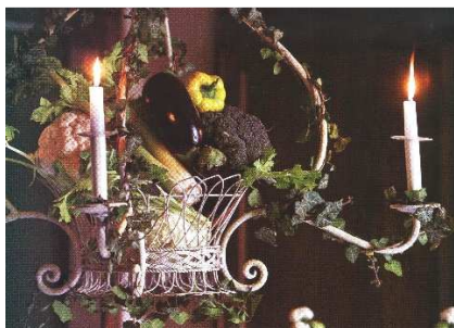
1 – Lampadario con trionfo di verdure