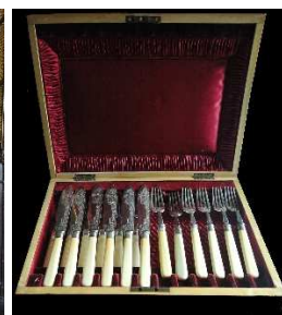
22 – Servizio di posate da pesce