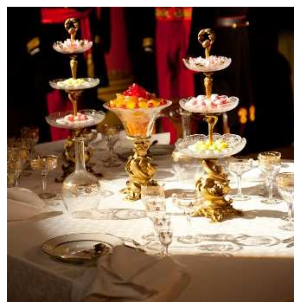
3 – Buffet dei dolci