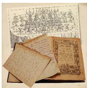
8 e 9 – Collezioni di ricettari (Ricettario dello chef Jules Gouffé)

Molto interessante è trovare su ogni tavola e scenografia l’abbinamento di ricette , tratte da menu e ricettari di varie epoche gelosamente custoditi negli archivi del Castello, che insieme agli allestimenti fanno immaginare e rivivere quei momenti di incontro di famiglia, ma anche quelli formali con ospiti importanti e nomi prestigiosi.