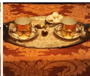
18 – Tazze da cioccolata “miroir”