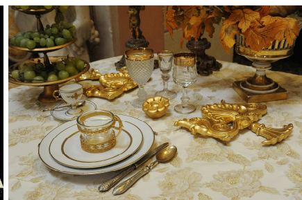
23 – Servizio di argenteria “vermeille” per la tavola “nozze d’oro”