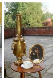
20 – Samovar per il “té alla russa” con ritratto della Principessa Bariatinski