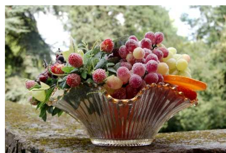
11 – Una ricetta del Castello: “L’uva brinata”

Molte volte i destini delle nazioni si sono decisi e si decidono ancora oggi a tavola... proprio questo conferma l’importanza che si dava sia all’allestimento della tavola che alla scelta delle portate, che sovente erano elencate sul menu con nomi che ricordavano la provenienza degli ospiti più importanti.