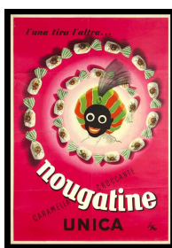
26 – Manifesto Nougatine - Unica