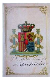
10 – Menu per un pranzo internazionale