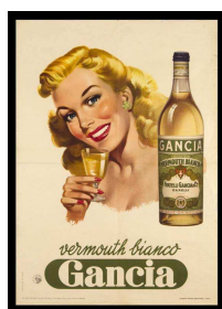
25 – Manifesto Gancia – Vermouth bianco, 1954