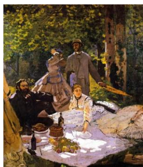
Déjeuner sur l'herbe - Claude Monet

Infine i “picnic nei dipinti di pittori famosi” : il fascino del picnic ispirò anche molti pittori famosi del '700, '800 e '900 tra cui James Tissot, Edouard Manet, Claude Monet, Paul Cézanne e molti altri che nei loro dipinti raffigurarono tovaglie sull'erba, piatti e bicchieri, frutta, pane e cibi vari portati dai commensali, ma anche fiori, giochi, strumenti musicali... Di alcuni di questi famosi dipinti si potranno vedere le riproduzioni .