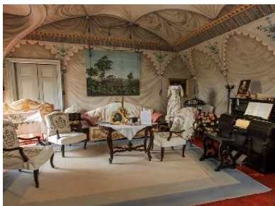
Il salotto blu