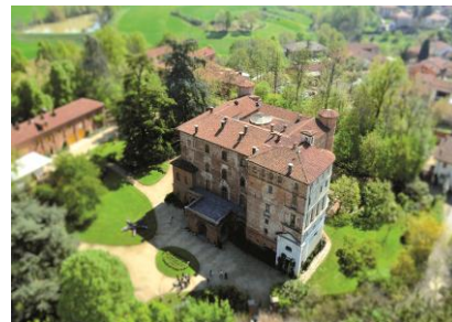
Il Castello di Pralormo