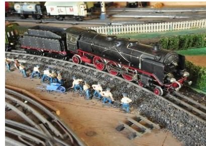
“Il trenino del Conte”

Al termine della giornata avverrà la premiazione , da parte della Contessa Consolata Pralormo, del miglior allestimento picnic realizzato dai personaggi in abiti.