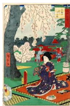
Picnic giapponese - Sakura in fiore