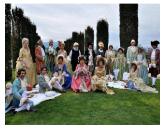
Esibizioni e giochi del gruppo storico Historia Subalpina

Tra i vari momenti di svago si potrà accedere per l'ora di pranzo alla zona del parco riservata allo svolgimento del picnic all'aperto : un'atmosfera suggestiva accompagnerà questo momento conviviale, tra grandi alberi e bellissime fioriture (per chi desidera acquistare il picnic è obbligatoria la prenotazione al Tour Operator Incoming Lab Travel: incoming@labtravel.it - 011.8128898)