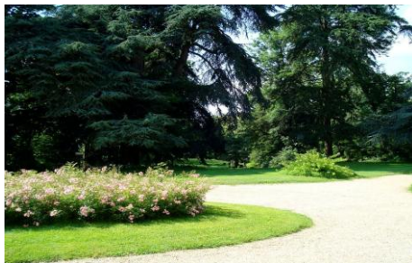
Il parco del Castello di Pralormo