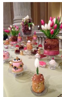
Allestimenti di vari buffet raffinati