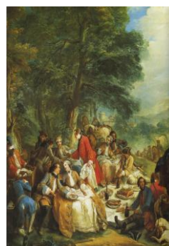
La Halte de chasse par Louis XV Carle Van Loo - Louis XV

PER I PIÙ PICCOLI: I bambini saranno affascinati dalla scenografia di un bosco in cui potranno ammirare minuscole fatine che trasportano piccoli frutti e preparano un picnic in miniatura .