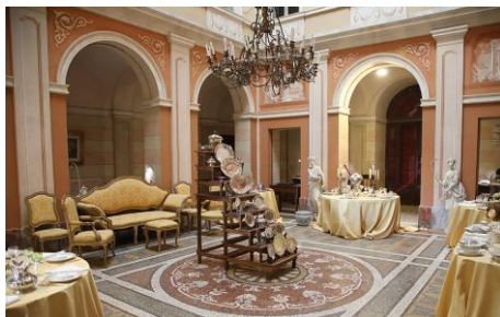
Il salone d'onore