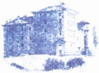
CASTELLO DI PRALORMO